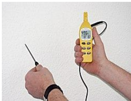
Hygromètre mesurant l'humidité d'un mur