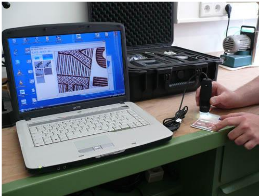
Inspection d'un billet de 10€ avec le microscope USB PCE-MM 200